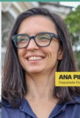
ANA PIMENTEL Deputada Federal